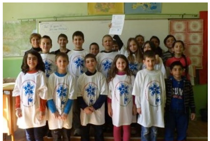
Деца от училище „Олимпи Панов“, гр. Русе, участващи в кампаниите на фондация „Помощ на лица с проблеми в развитието“

Дейността на организацията започва през 2010 година с обучения на родители, учители и специалисти за състоянието аутизъм и стратегии за справяне със ситуации. През 2011 г. инициират в България кампанията „Light It Up Blue“. Чрез Фейсбук над 500 души научават за състоянието аутизъм, запалват сини светлини в домовете си и обличат сини дрехи. „Така станаха наши приятели. Заедно направихме едномесечна изложба от творби на деца от аутистичния спектър в Националната художествена галерия, за да покажем чрез изразните средства на изяшното и приложно изкуство уникалния свят на аутистичните личности.“